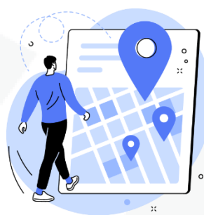
seus hábitos de deslocamento