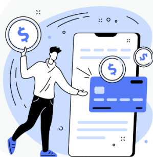
seus hábitos de consumo