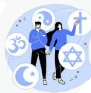
sua preferência religiosa

Agora fica fácil você compreender que o uso mal intencionado desses dados pode criar muitos problemas, como ocorre com os conhecidos golpes de boletos bancários, fraudes em contas de aplicativos, abertura indevida de contas bancárias e de consumo.