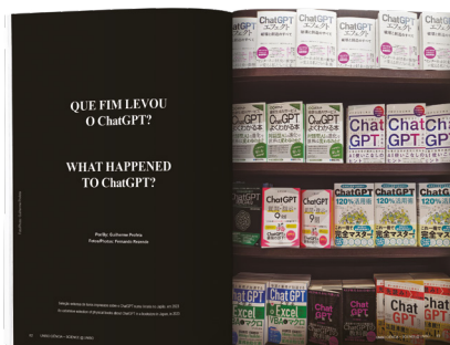
“Que fim levou o ChatGPT?” (jun./2024)