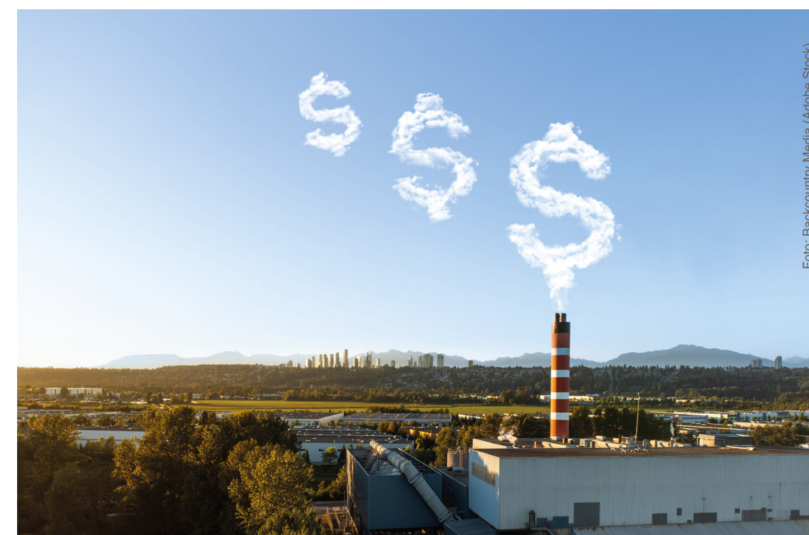
O meio ambiente não deveria ser gratuito — ele precisa, sim, ser precificado! —, defende pesquisador japonês

A concepção de mecanismos econômicos como os dividendos de carbono é um exemplo de como as soluções para a crise ambiental envolvem mais do que abordagens puramente tecnológicas. Não que essas abordagens não sejam importantes, naturalmente, mas o problema envolve, também, outras dimensões (sociais, políticas, econômicas e culturais), daí a necessidade de adotar uma postura interdisciplinar, que articule as Ciências Exatas e as Humanidades, assim abrindo caminho para estratégias alternativas que possam emergir simultaneamente em diferentes frentes. Afinal, essas soluções são urgentes — e talvez nós já estejamos atrasados demais.