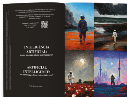
“Inteligência Artificial: pode a tecnologia redefinir os limites da arte?” (jun./2023)

Desde 2023, o projeto Uniso Ciência vem publicando em sua revista internacional uma série de reportagens temáticas sobre IA. Siga os links pelos QR codes para acessar: