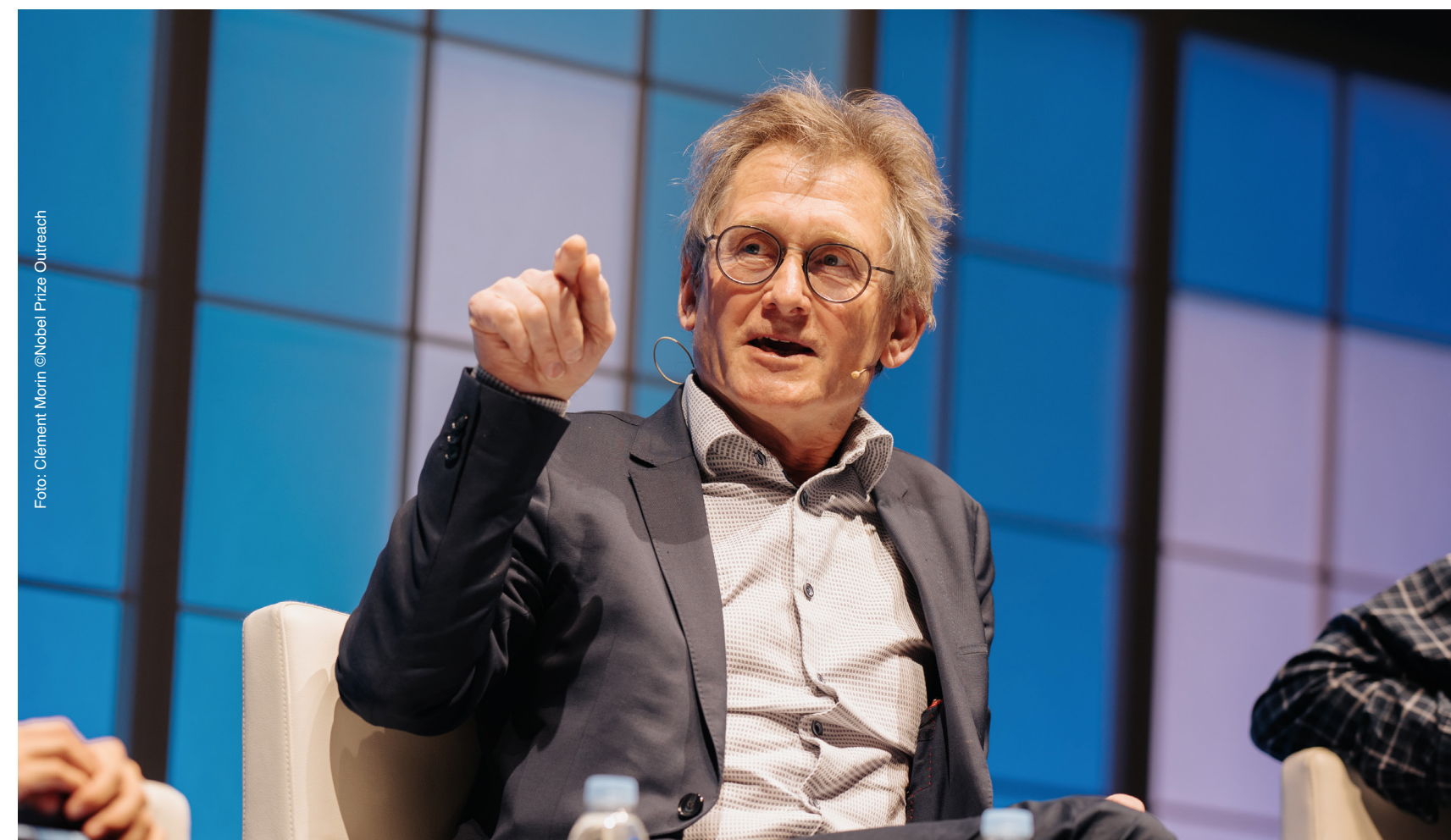
O professor doutor Bernard Feringa, laureado com um Prêmio Nobel em Química em 2016, defende que projetar materiais intencionalmente menos duráveis constitui uma mudança de paradigma

No contexto da ciência dos materiais — campo que integra a Física, a Química, as Engenharias e outras áreas do conhecimento para estudar as propriedades, o desempenho e o processamento dos materiais criados e utilizados pela humanidade —, a preocupação com a sustentabilidade vem impondo transformações profundas na forma como projetamos os ciclos de vida dos mais diversos produtos, desde a extração dos insumos até o descarte adequado e a reciclagem.